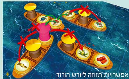
אפשרויות תזוזה ליורש הורוד

לדוגמה: "סליחה אני רק עובר כאן לידך, אבל צריך את פסל הבודהה שמתחתך".